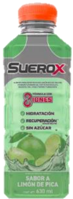
Lanzamiento de Suerox® en Chile