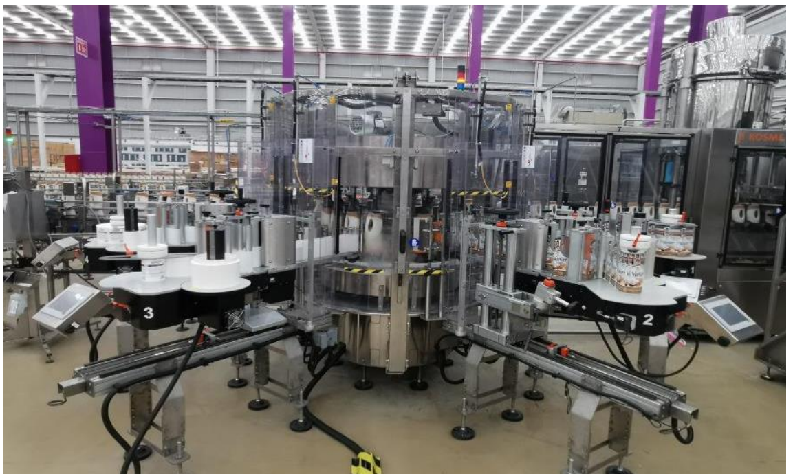
Línea de Manufactura de Shampoo

1.8 millones de botellas de shampoo producidas durante 2T-2022