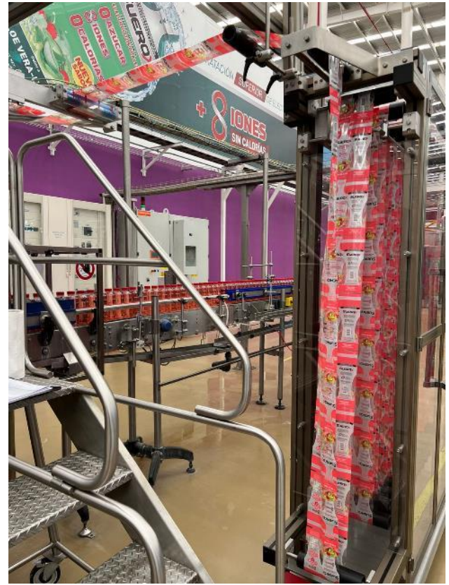
Línea de Manufactura de Bebidas Isotónicas