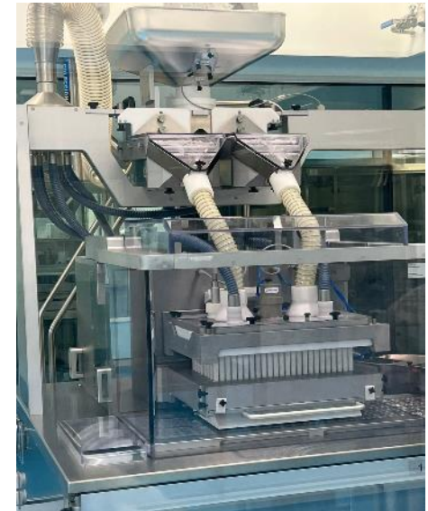
Línea de Manufactura de Productos Sólidos OTC