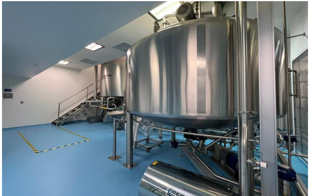
Línea de Manufactura de Productos Semi-sólidos OTC

100% de la demanda nacional para X Ray® Gel producida en nuestra planta OTC